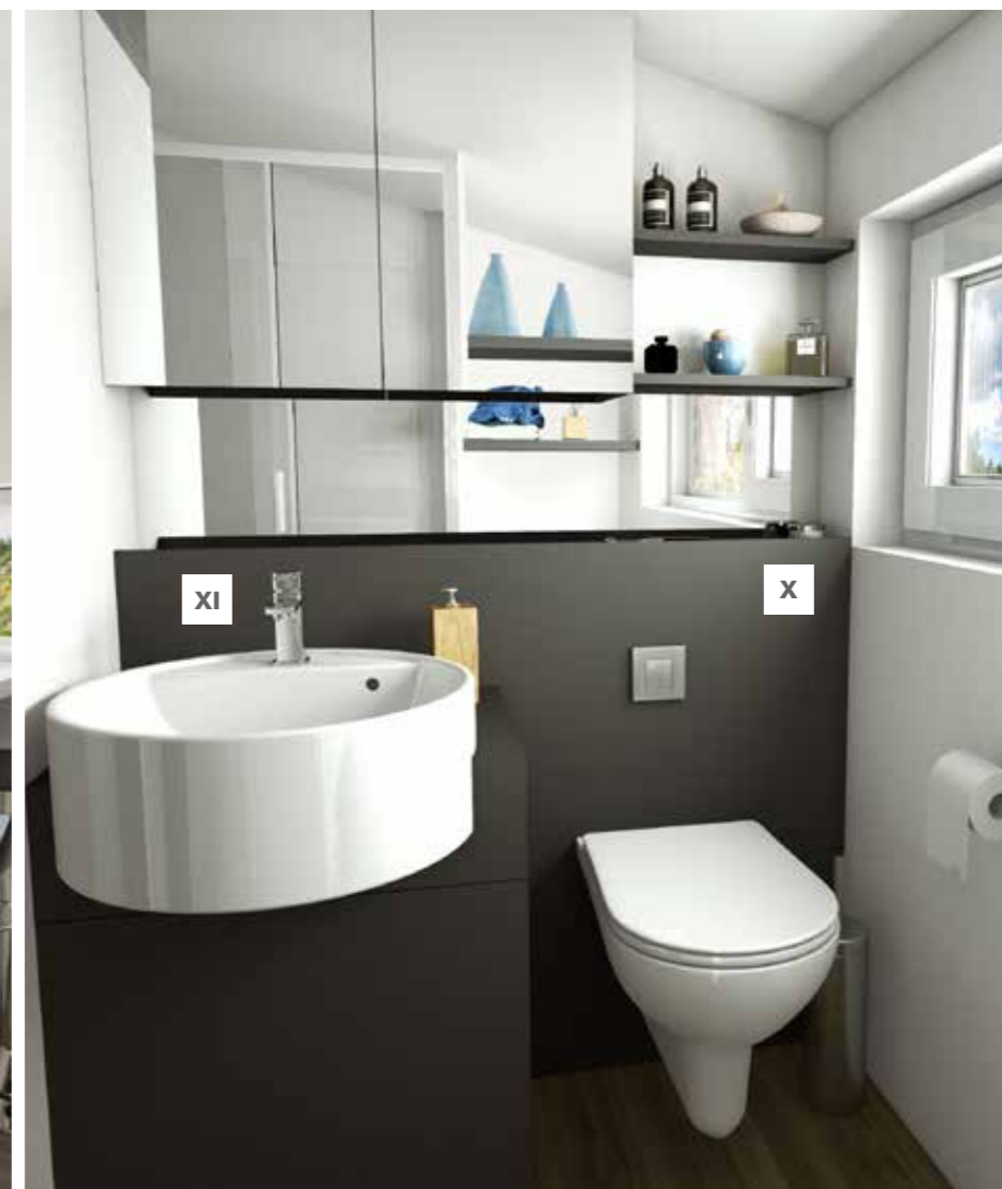
VIII. Clever storage solutions