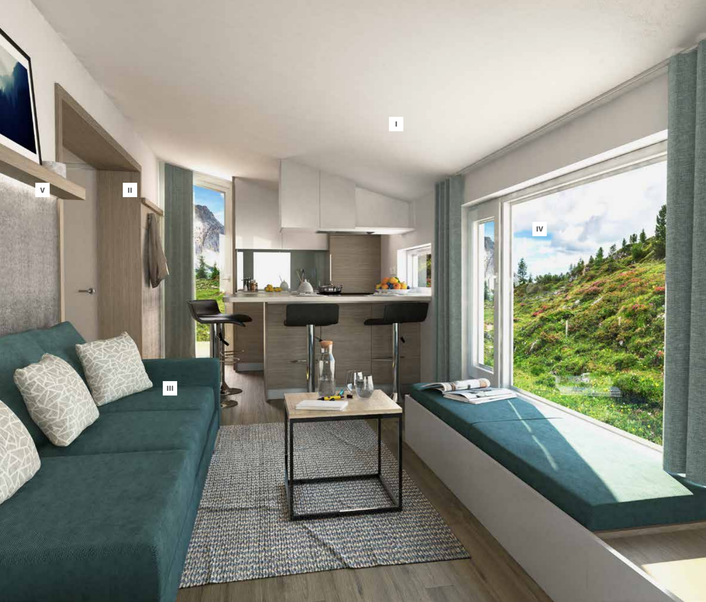
I. Modern open space