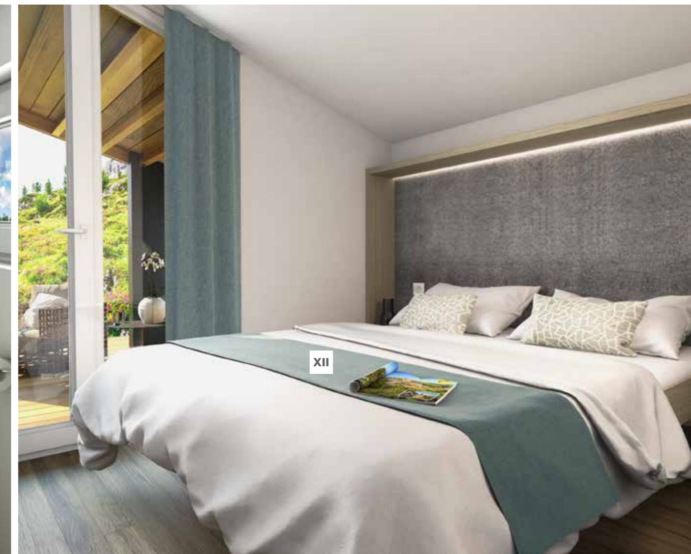
XII. Spacious and comfortable king size bed

XI. Hochwertige Ausstattung und leistungsstarke Dusche