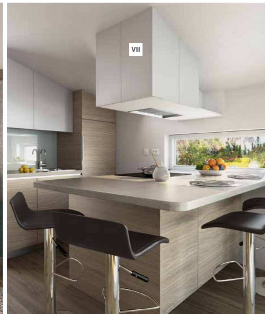
VII. Island kitchen with best appliances

VI. Multimedia-Ecke mit Sitzbank samt Stauraum