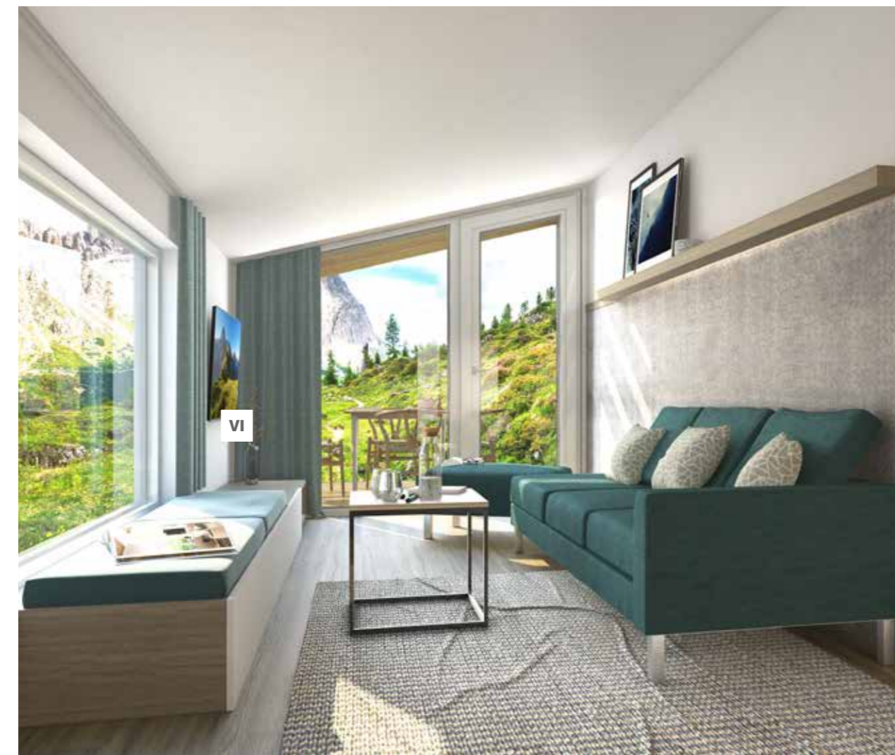
VI. Multimedia corner with lounge bench with storage

Komfortable Schlafzimmer mit Hauptschlafzimmer – so großartig wie jene inspirierenden Aussichten. Tauchen Sie mit Ihren müden Muskeln in Ihrem eigenen Spa-Bereich ein. Genießen Sie die leistungsstarke Dusche und alle zu erwartenden Merkmale, um sich zu erfrischen und zu revitalisieren.